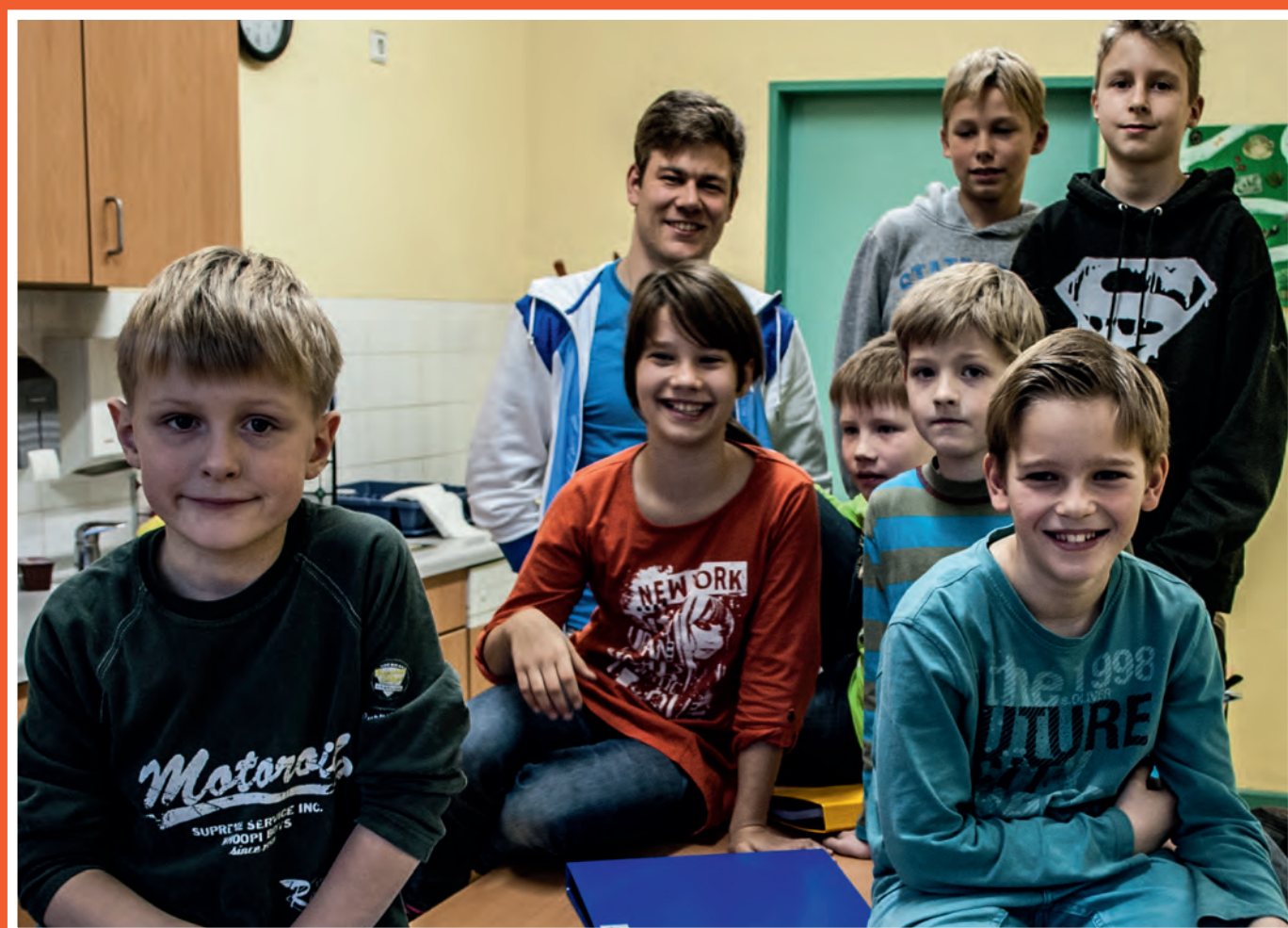
Das erste Gruppenfoto der Energiemanager. Wir sind gespannt, wie das Projekt werden wird.