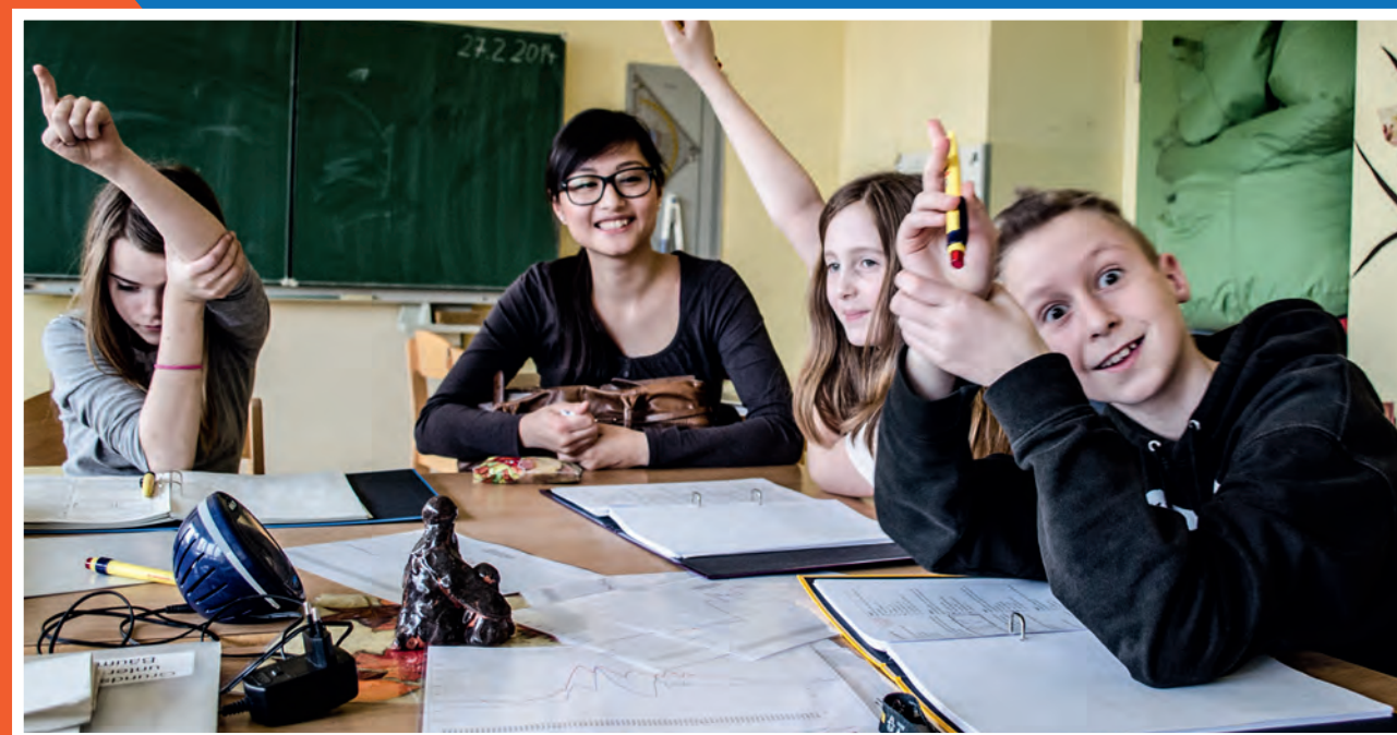
Wichtige Besprechung: Was ist der nächste Schritt? Es geht heiß her bei den wöchentlichen Treffen der Energiemanager im Schülerclub.